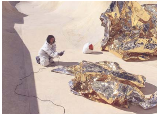
© Compagnie Le Théâtre dans la Forêt

Onze habitants de la commune vont ainsi participer à l'élaboration d'un spectacle qui sera donné