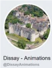
Dissay - Animations @DissayAnimations